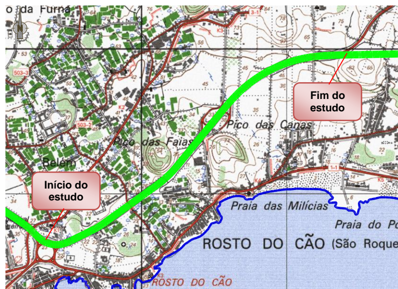
Figura 1 – Enquadramento geográfico do lanço em análise

Na Figura 1, apresenta-se o enquadramento geográfico do lanço em estudo.